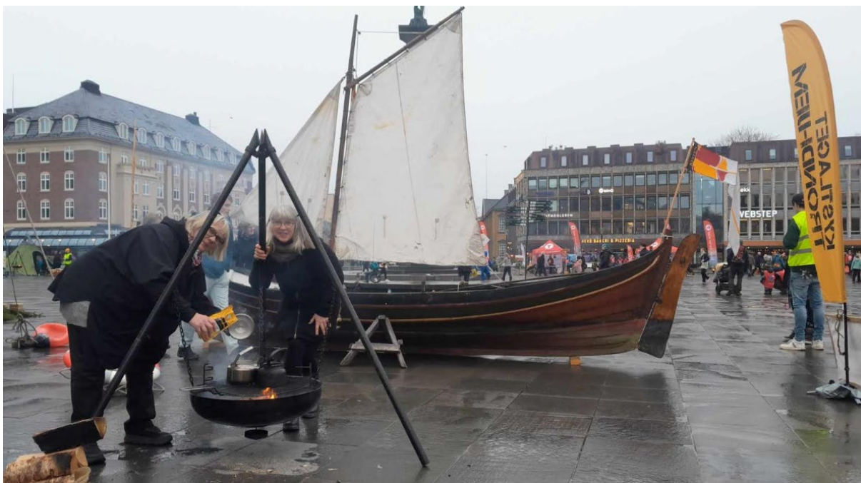
Kystlaget stilte med bål og færing på Torvet.