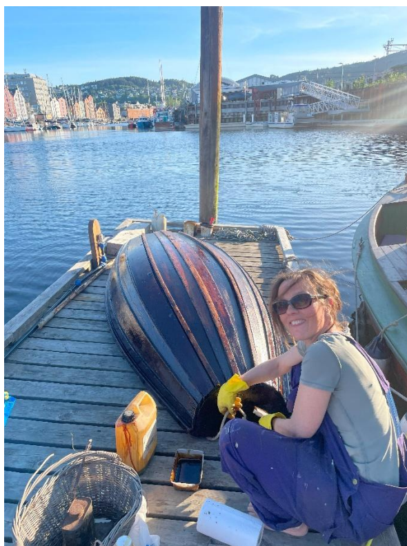
Kark-dugnad på Fosenkaia.