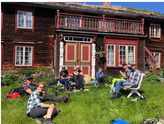
Barkedugnad i Budal.