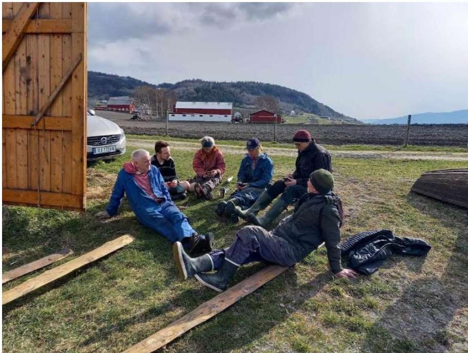
Høvedsmenn planlegger sommerens aktiviteter

Høvedsmannsrådet består av 3 personer som velges på årsmøtet, derav to høvedsmenn. Rådet utarbeider retningslinjer for høvedsmenn og har ansvaret for godkjenning av høvedsmenn.