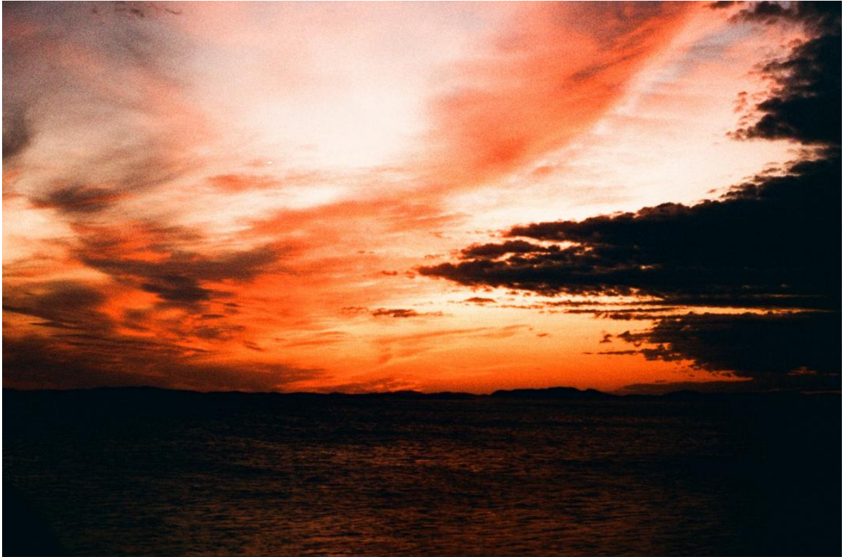
Solnedgang på Gimsa, sommerseilas