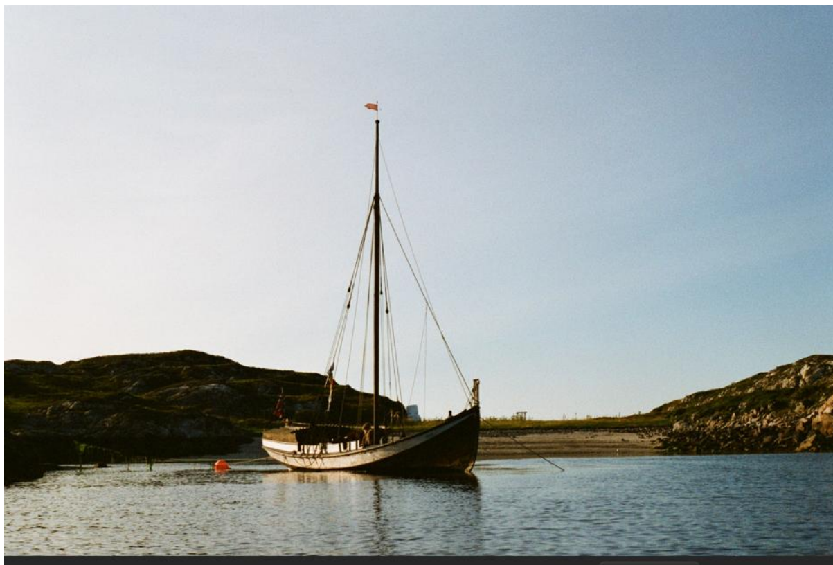
Hemmelig bukt med sandstrand på Inntian (Frøya), lokalt kjent som paradisbukta