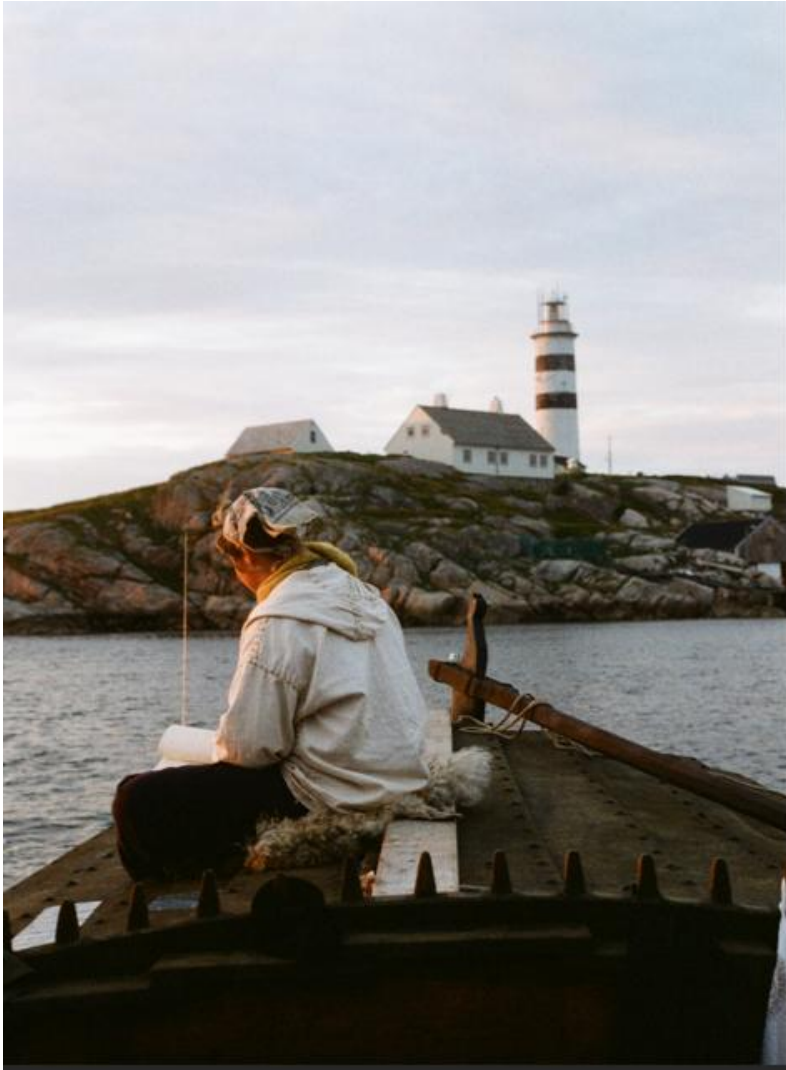
Nidaros i havna på Halten med fyret i bakgrunnen, Foto: Adam Krupicka