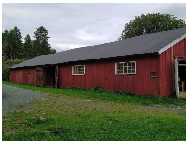
Naustet på Rotvoll

Ved båtoppsettet om høsten ble Fønix og Havsula satt inn i Rotvollnaustet. Futen ble plassert i Gulskuret fordi den trengte reparasjon.