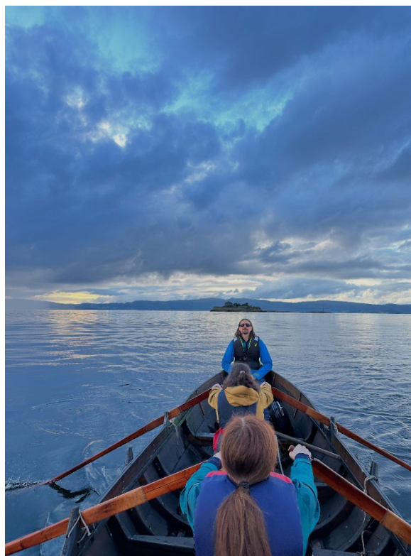
Med Futen til Munkholmen i juli

Fønix II: Vi fant et par råteskader på sidebordene på båten. Skadene er små og har ingen praktisk betydning for funksjonen. På sikt må imidlertid aktuelle bord skiftes. Båten hadde en ødelagt keip i starten av sesongen, som gjorde at bruken av båten ble litt mindre enn årene før. Etter hvert fikk vi på plass en midlertidig løsning.